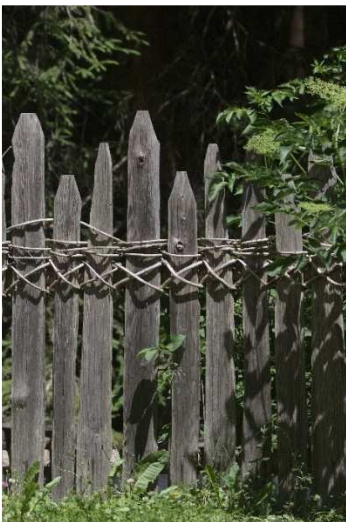
Bild 13: Klassischer Speltenzaun mit gespaltenen Hölzern und Kreuzflechtung