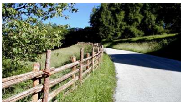
Bild 5: Stangenzaun am Regglberg mit dünnerem und längerem „Zusteck'n“